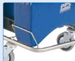
22 mm Edelstahl-Rohrrahmen