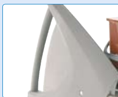
frei wählbare Griffhöhe