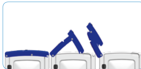
Maximale Benutzerfreundlichkeit: Die Eimer zur Oberflächenreinigung sind voll zugänglich.