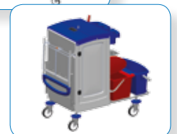
Maximale Raumausnutzung: Große Inhalte, klappbare Anbauteile.