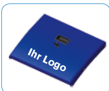
Maximaler Zusatznutzen: Anbringung von Logos und Beschriftungen auf vielen verschiedenen Flächen des Clino Protect.