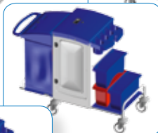
Maximale Variabilität: Alle Reinigungsverfahren möglich.