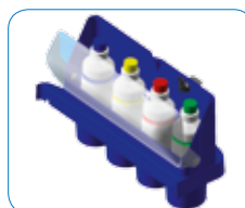
Maximale Transparenz: Sicher verschlossen und trotzdem im Blick.